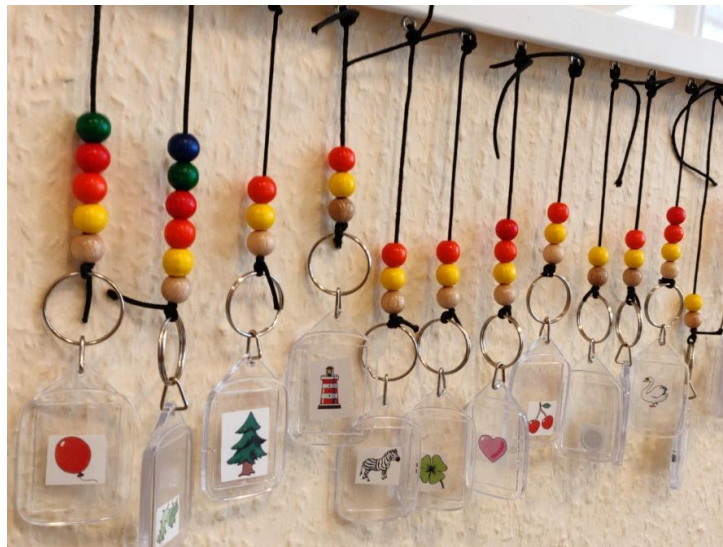
Eine Perle für jeden Geburtstag!

Schon im Vorfeld kann jedes Kind sehen: Bald habe ich Geburtstag! Der Geburtstagskalender in der Gruppe kündigt es schon an! Und die Geburtstagsperlen verraten auch schon wie alt das Kind wird. Die Vorfreude beginnt und auch die Gespräche darüber. Wie heißt der Monat in dem ich Geburtstag habe, ist es im Sommer oder im Winter? Wie viele Kinder haben noch vor mir Geburtstag?